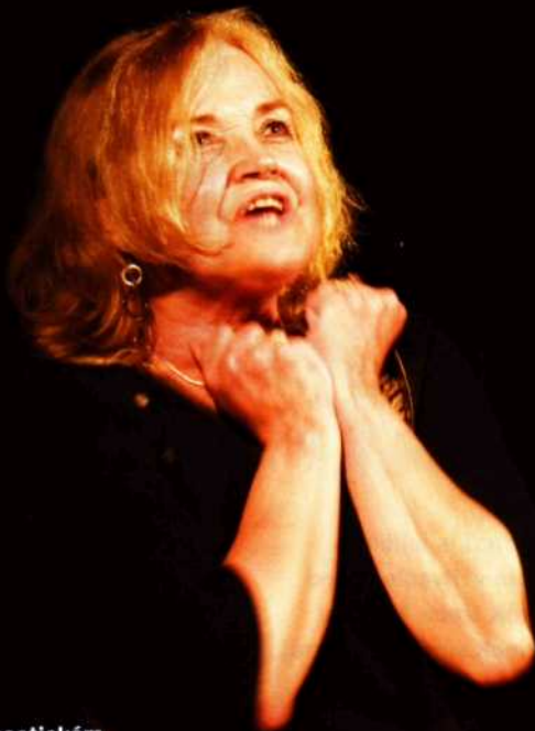
Procitěná recitace na poetickém večeru v kině MAT.

Jakýpak vzpomenete, já jich mám dost pořád a jsem ráda, že existují... (směje se). Jeden pán mi poslal celou knížku sebraných výstřižků, které o mně nějak pojednávaly. Psal, že končí, že se jeho dny nachylují... bylo to až dojemné. Víte, nejkrásnější je, když jdete po ulici a lidi se na vás usmějí. Nebo když jedu autem, zastavím na křižovatce a někdo mi zamává. Zaplat' pánbůh, že to stále trvá. Dokonce mám pocit, že v posledních dvou letech jsou ke mně lidé milejší.