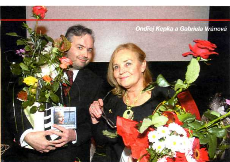
Ondřej Kepka a Gabriela Vránová

Velkou radost si před svátky udělala herečka Gabriela Vránová. Dala totiž spolu se svým synem, režisérem Ondřejem Kepkou, dohromady dvojčeděčko Moji básnici, které je záručením její celoživotní lásky k poezii.