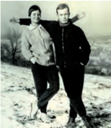
1961 – Vánoce s bratrem